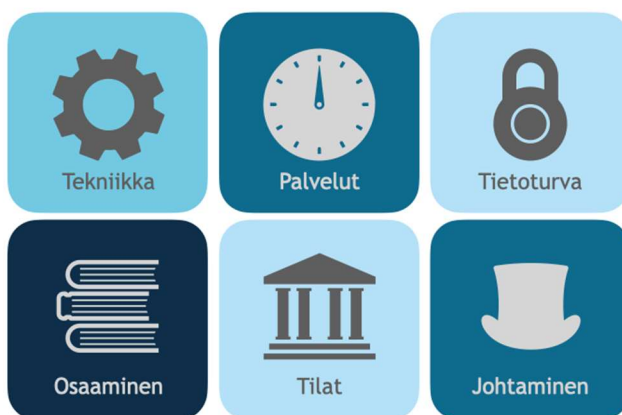
Kuva 1. Tieto- ja viestintäteknikan suunnitelman viitekehys