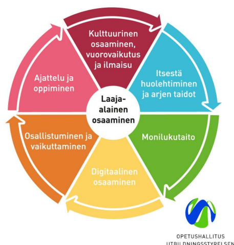
Kuva 2. Laaja-alainen osaaminen varhaiskasvatuksessa ja perusopetuksessa

Laaja-alainen osaaminen on muun muassa monilukutaitoa, itsestä huolehtimista ja arjen muita taitoja. Se on myös kulttuurista osaamista, vuorovaikutustaitoja ja digitaalista osaamista, joita tarvitaan yhä monimuotoisemmassa maailmassa. Hyvä varhaiskasvatus ja perusopetus antavat vahvan pohjan näiden tietojen ja taitojen kehittymiselle.