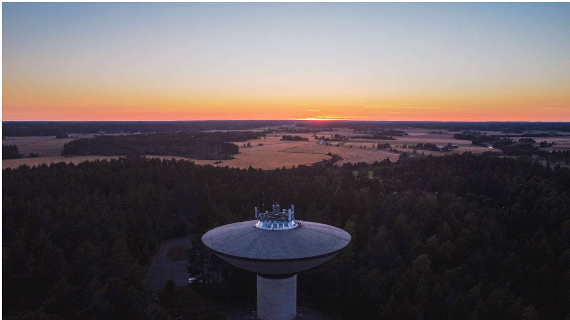
Kuva: Liedon vesitorni, Simo Lamminen

Tarkastuslautakunta suosittelee, että investointien määrärahalisäysten sijaan pyrittäisiin ensisijaisesti tekemään tarvittavia talousarviomäärärahamuutoksia investointihankkeiden kesken.