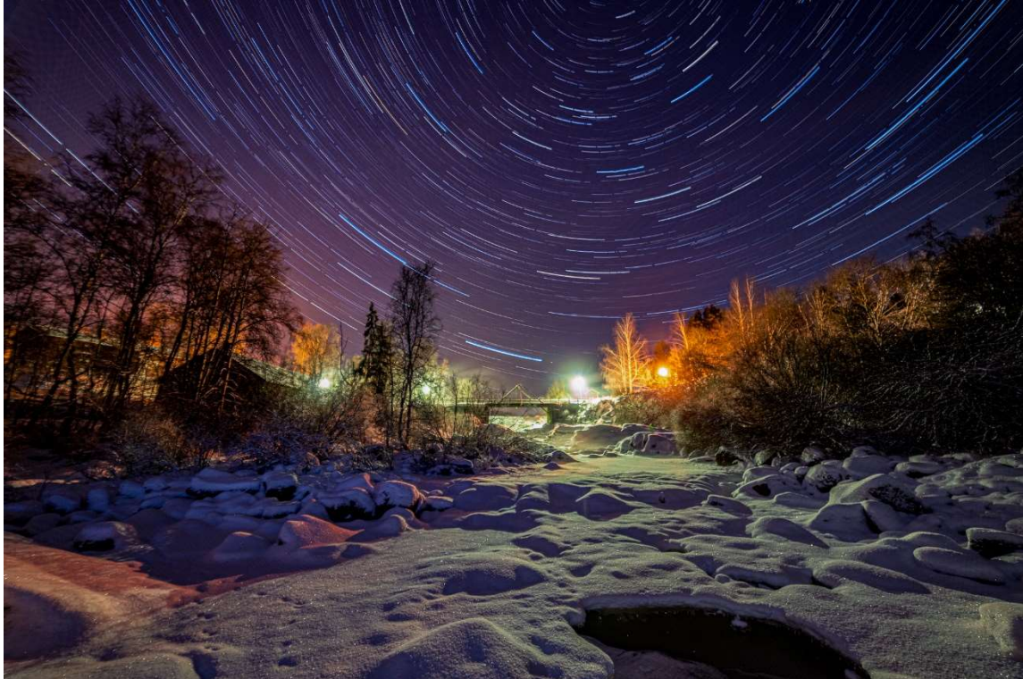
Kuva: Nautelankoski, Simo Lamminen

Tarkastuslautakunta jättää arviointikertomuksen vuodelta 2023 kaupunginvaltuuston käsiteltäväksi ja esittää, että kaupunginvaltuusto pyytää arviointikertomuksessa esitetyistä havainnoista ja johtopäätöksistä (tarkastuslautakunnan kannanotto) kaupunginhallituksen selvitykset niin, että ne voidaan käsitellä vuoden 2024 lokakuun valtuuston kokouksessa.