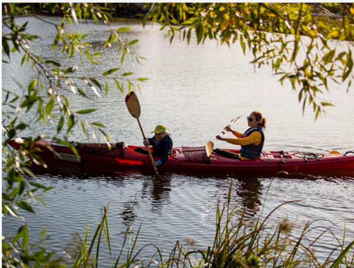
kuva: Littoistenjärven melontareitti sopii koko perheen kohteeksi.

Tarkastuslautakunta haluaa muistuttaa, että kaupungin hallintosäännön 73 §:n mukaan talousarvioon tehtävät muutokset on esitettävä valtuustolle siten, että valtuusto ehtii käsitellä muutosehdotukset talousarviovuoden aikana. Talousarviovuoden jälkeen talousarvion muutoksia voidaan käsitellä vain poikkeustapauksissa. Kuntalain 110 §:ssä määrätään, että "Kunnan toiminnassa ja taloushoidossa on noudatettava talousarviota" . Tarkastuslautakunta kehottaa toimialoja tarkentamaan taloussuunniteluaan.