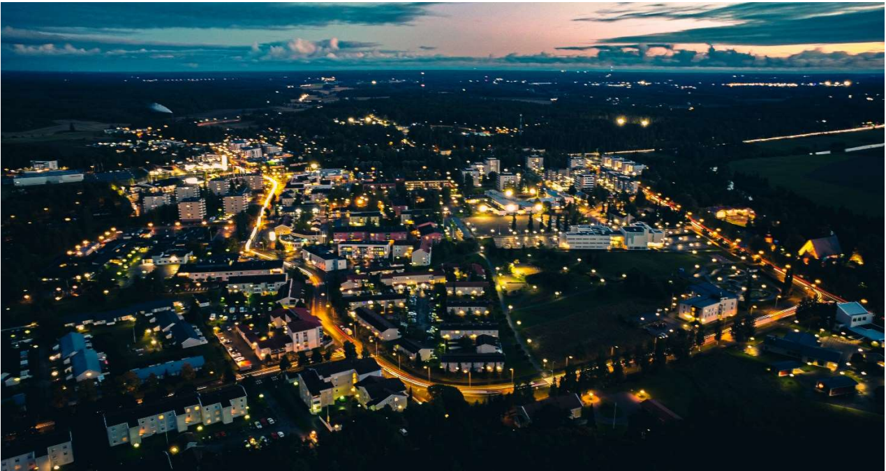
Kuva: Lieto: Simo Lamminen