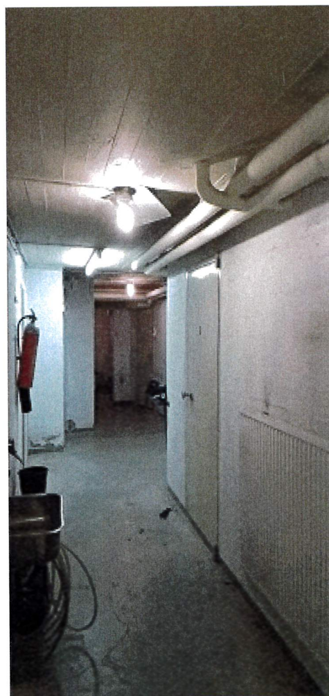
Kellarin käytävä, asbestieristeisiä putkia.