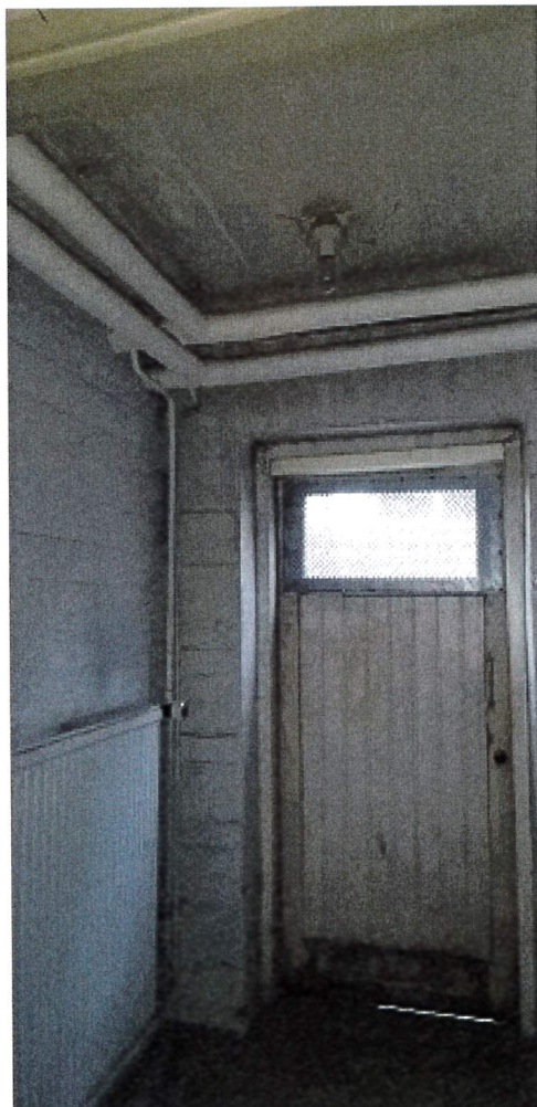
Pieni eteistila, asbestieristeisiä putkia.

Ullakon paisuntasäiliö ja putket, ei havaittu asbestia.