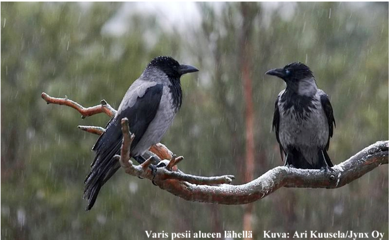
Varis pesii alueen lähellä

Lajisto on tavanomaista ja tyypillistä seudun metsä, pelto- ja kulttuuriympäristölajistoa. Savijoen notkossa on linnustoarvoja, mutta alue jää tämän kaava-alueen ulkopuolelle.