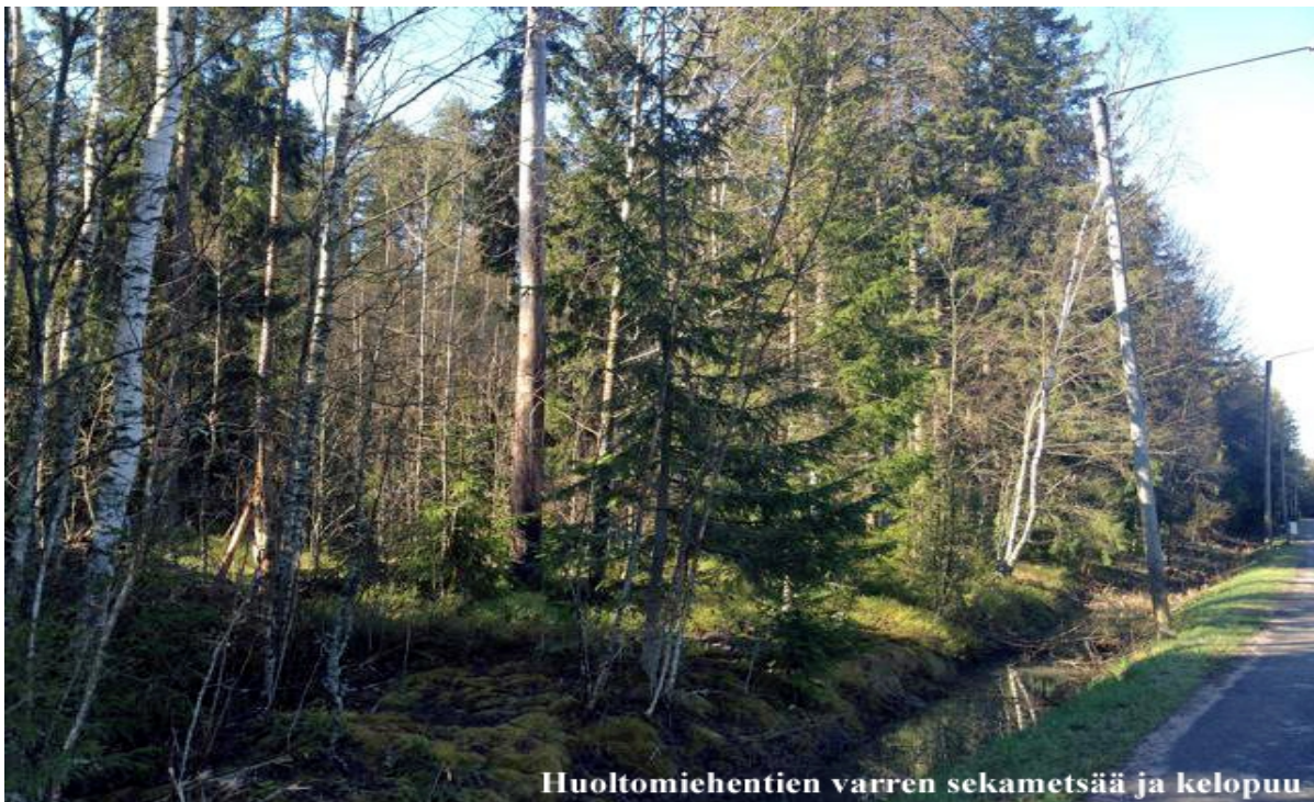
Huoltomiehentien varren sekametsää ja kelopuu

Selvityssalue rajautuu Liedon Savijokilaakson luontoselvityksessä (2003) tarkasteltuun Äyräksen runsaslajisiin ketoihin ja niittyihin, joilla kasvaa arvolajistoa, kuten sikoangervo, keväthanhikki, nuokkukohokki, litteänurmikka ja ketopiippo.