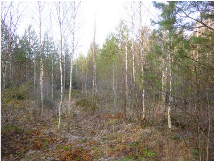
Pohjoisosan soista taimikkoa.