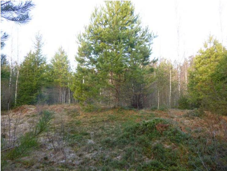
Näkymä pohjoisosan pikkuharjanteelta.