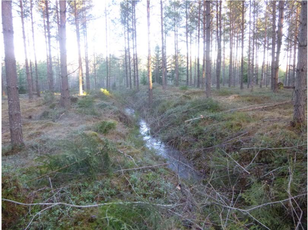
Näkyä luoteeseen alueen keskiosan loivasta harjanteesta ja sen lounaispuoleisesta ojasta. Alueen metsä on luoteisosassa (taustalla) nuorta taimikkoa ja kaakkoisosassa (etualalla) nuorta metsää. Oja laskee luoteeseen.