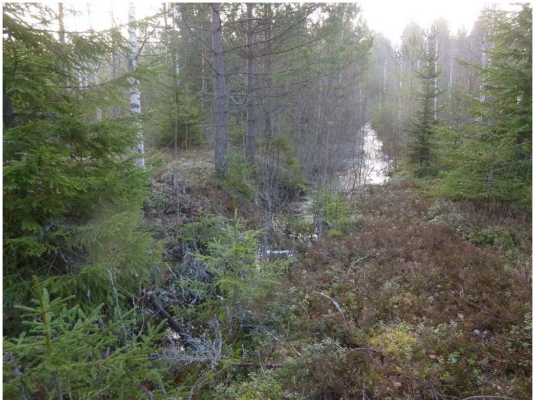
Näkymä kaakkoon alueen keskiosan ojan ympäristöstä taimikkoalueelta. Kuvan vasemmasta reu nasta alkaa pieni lounais-koillis-suuntainen harjanne, mikä ulottuu lähelle koillispuoleista peltoa.