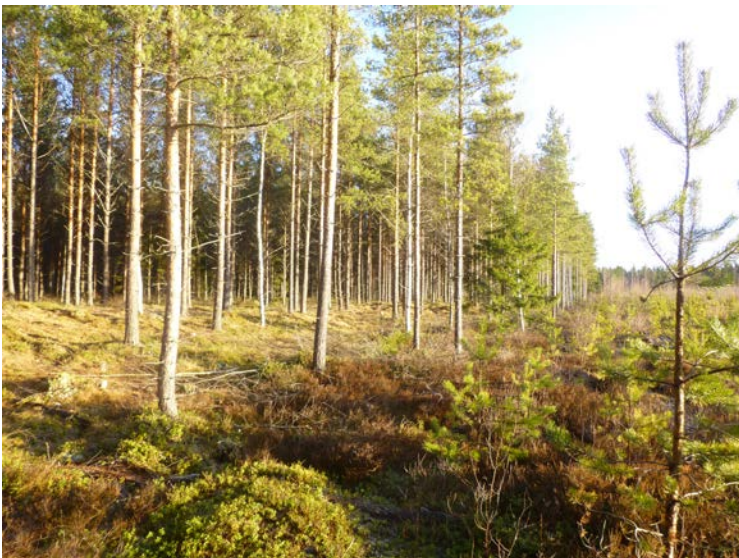
Eteläosan nuorta metsää rajalla