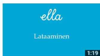
Ella OPASVIDEO1 Lataaminen 1 näyttökerta • 1 tunti sitten