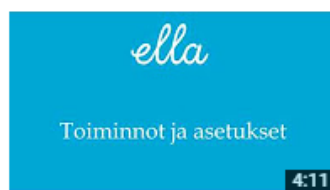
Ella OPASVIDEO3 toiminnot ja asetukset Ei näyttökertoja • 1 tunti sitten