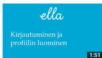
Ella OPASVIDEO2 Kirjautuminen ja profiilin luominen Ei näyttökertoja • 1 tunti sitten